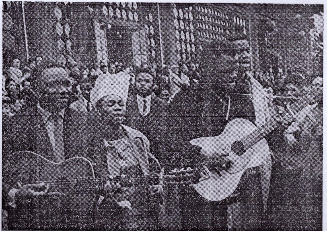
Nos artistes parmi les populations amies de Chine

De mars à août 1966, le ballet «DJOLIBA» a donné des représentations artistiques dans plusieurs villes à travers la Ré-